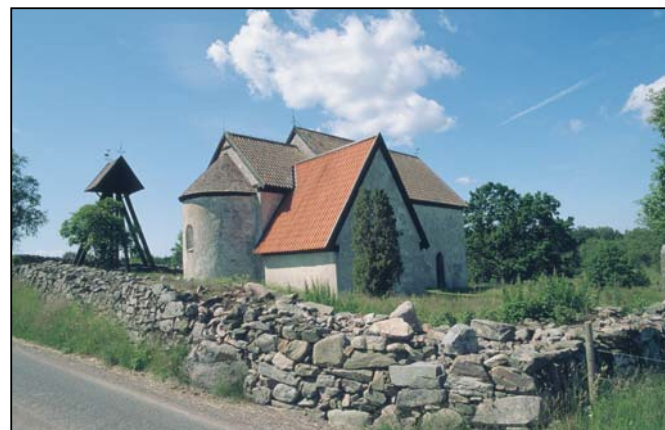
Hemmesjö medeltida kyrka ligger i ett naturlandskap av riksintresse.

Hela "Sigfridsleden", från Asa till sydänden på sjön Rottnen, är ca 90 km lång. Här vid södra änden av den stora sjön Rottnen (ca 25 km sydost om Växjö, H 12) finns en liten sjö som heter Tomtsjön . Den vandrar Du runt på ca en timme. I Åryd (ca 15 km sydost om Växjö, F 9) kan Du vandra på "Sigfridsleden" både norrut och söderut. Man kan givetvis vika av från leden och gå in på småvägar runt omkring så man får en runda i stället. T ex kan Du vandra på leden från Hemmesjö medeltida kyrka (F 9) till Åryds gamla bruksområde och tillbaka till Hemmesjö över Billa och Kullen.