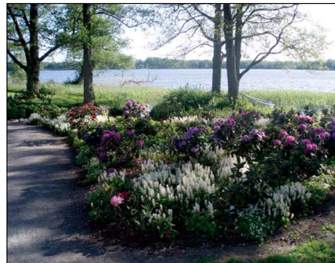
Praktfull blomning vid Växjösjön.

Hälsans Stig är en skön vandring runt Växjösjön – mitt i staden!. Leden, som är skyltad, är 4,5 km lång. Andra rundor med start t ex vid Växjösjön är Sjöspåret . Spårlängderna är mellan 4,5 km till 13 km.