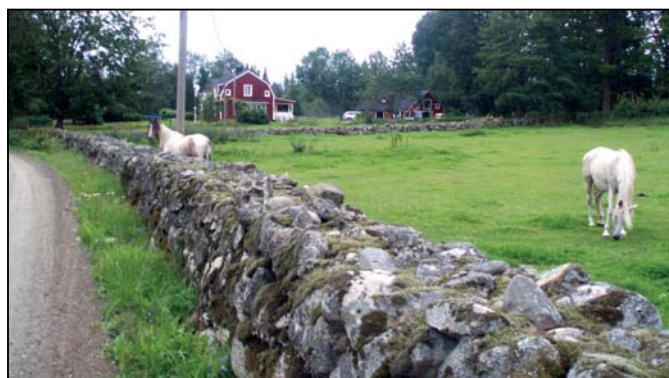
Gammal mossbeklädd stenmur vid den gamla Växjövägen i Djura Nöbbele V.

Tegnaby-trakten (väg 30 söderut): Tegnaby mot Tofta och Lerbäcken och tillbaka.