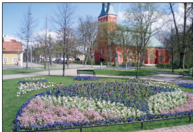
Vårblommor i Linnéparken. I bakgrunden står en byst över Carl von Linné.