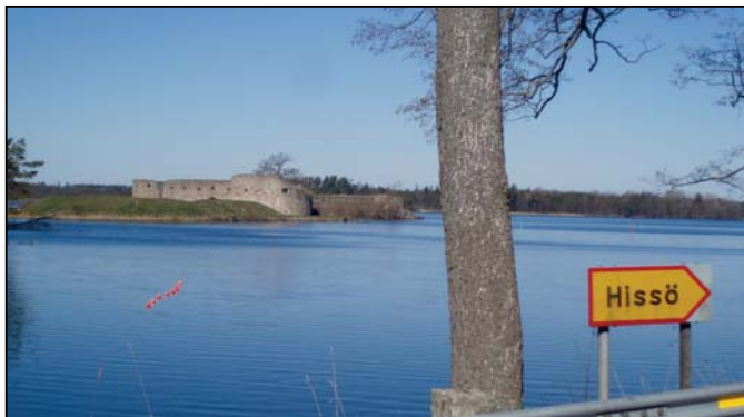
Vy över Kronobergs slottsruin på Kronobergshalvön.

Araby samt Stora och Lilla Pene naturområde på Kronobergshalvön (D 7), Hissö och Musön vid Kronobergs slottsruin. Till Musön (se skylt på Hissö) tar Du Dig med en liten dragflotte! Där finns en 800 m lång, njutbar vandringsstig vid sjökanten med skiftande naturinslag.