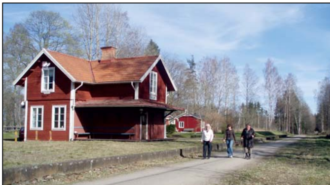
Vårvandring vid det gamla stationshuset i Evedal

Vandringsleden "Sigfridsleden" är en av de leder som Du kan ta deltagelse av för kortare vandringar. Du kan börja med att gå från Växjö ut till Evedal (E 7) på den nedlagda gamla smalspårsjärnvägen, numera cykel- och vandringsväg, ca 6 km. Starta vid parkeringen på Lärkgatan bakom hotell Royal Corner. Sedan kan Du fortsätta att gå från Evedal till Sandsbro , ca 3 km, på samma nedlagda smalspårsjärnväg. Från Sandsbro kan Du gå vidare norrut på järnvägsbanken för att vika av in på "Sigfridsleden" till Hoppet, vid väg 23, ca 8 km, eller gå tillbaka på leden till Sandsbro.