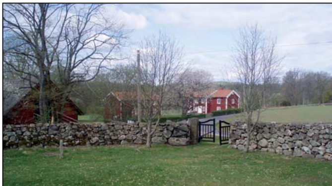
Utsikt från kyrkbacken vid Drevs medeltida kyrka.

Nordväst om Växjö: Från Kronobergshed (norr om Alvesta/Lekaryd, A 6/7) mot Elofstorp, Sköldstad, Hjärtanäs, Dansjö, Kronobergshed.