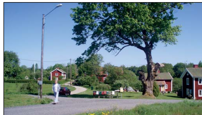
Bymiljön i Lönås.

Väster om Växjö: Bergkvara slottsruin med omgivning (C 8), Långstorp norrut mot Lönås (C 7).