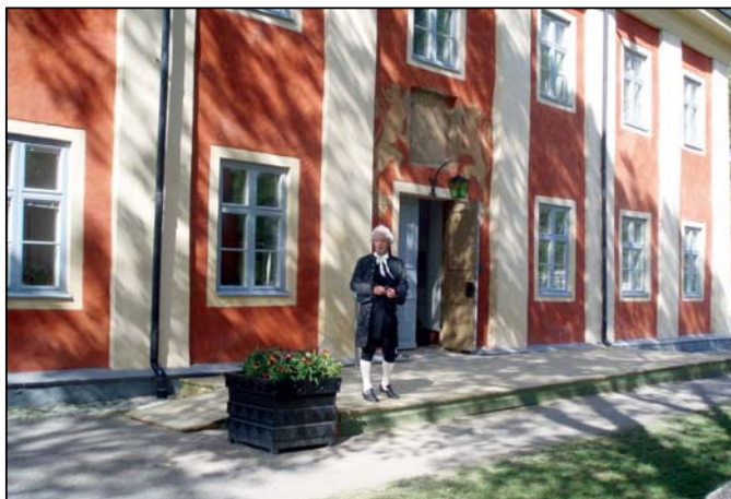
"Carl von Linné" framför sin gamla skola, Karolinerhuset invid Domkyrkan i Växjö.

Parkförvaltningen i Växjö ordnar ibland guidade turer. För info gå in på www.vaxjo.se , klicka vidare till "se och göra - evenemang - park- och stadsvandringar". Eller ring 0470-412 94, 762 904.